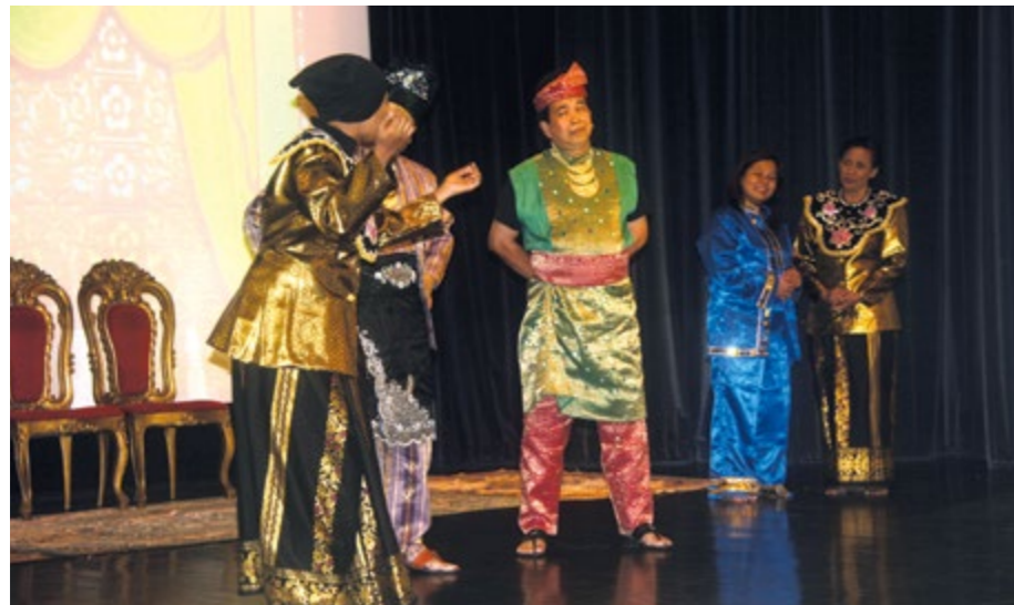
[Atas sekali] Gambar awal pementasan bangsawan, 1900.