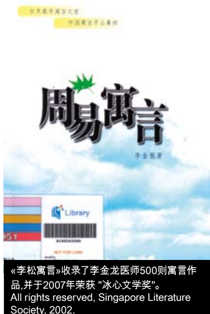
《李松寓言》收录了李金龙医师500则寓言作品，并于2007年荣获“冰心文学奖”。 All rights reserved, Singapore Literature Society, 2002.