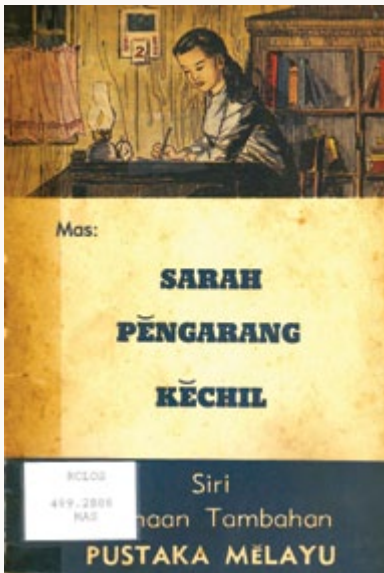
All rights reserved. Pustaka Melayu, 1960.

Singapura, semenjak merdeka pada Ogos 1965, Kementerian Kebudayaan Singapura telah melantik suatu Jawatankuasa Ejaan Rumi Melayu Singapura.