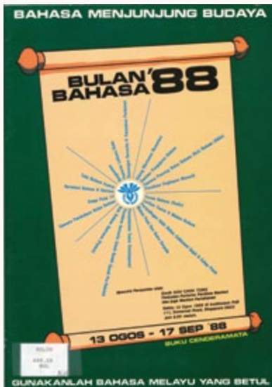
Jawatankuasa Bulan Bahasa, Jawatankuasa Bahasa Melayu Singapura, 1988.