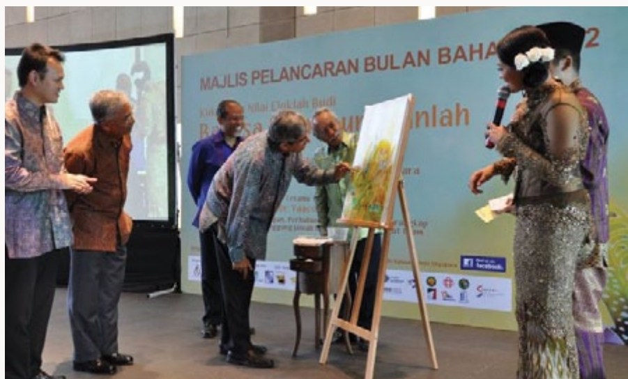
Menteri Penerangan, Perhubungan dan Kesenian & Menteri Bertanggungjawab Bagi Ehwah Masyarakat Islam, Dr Yaacob Ibrahim di pelancaran Bulan Bahasa 2012 di Bangunan Perpustakaan Negara.

Memandangkan tugas Jawatankuasa Bahasa itu semakin luas, dalam beberapa mesyuaratnya telah saya sarankan supaya nama JBMS dipinda menjadi Majlis Bahasa Melayu Singapura (MBMS).